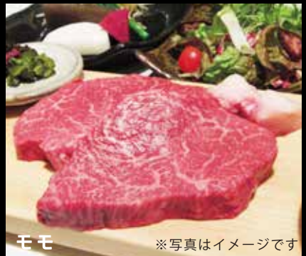
モモ ※写真はイメージです

※神戸牛の素牛となる但馬牛の血統を継いだ主に兵庫県産黒毛和牛を使用した当店お薦めコース。A5ランクを使用。