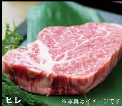
ヒレ ※写真はイメージです