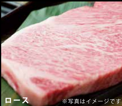
ロース ※写真はイメージです

※兵庫県産 石田屋厳選牛とは 神戸牛の素牛である但馬牛の血統を強くひき神戸牛により近い上質な和牛を 神戸石田屋が厳選した黒毛和牛です